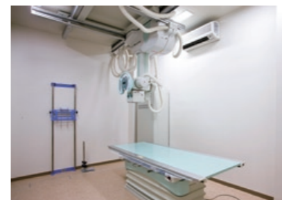
レントゲン室には、骨粗鬆症の検査をする最新式の骨密度測定装置も導入

2010年9月1日 OPEN たさか整形外科クリニック 〒816-0904 大野城市大池1-7-3 診療時間 月・火・木・金曜日 9:00 ~ 12:30 14:30 ~ 19:00 水・土曜日 9:00 ~ 13:00 休診日 日曜・祝祭日・水曜午後・土曜午後 TEL.092-504-4896 http://tasaka-seikei.jp