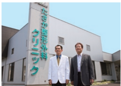
クリニックの前に並ぶ田坂院長と久保社長